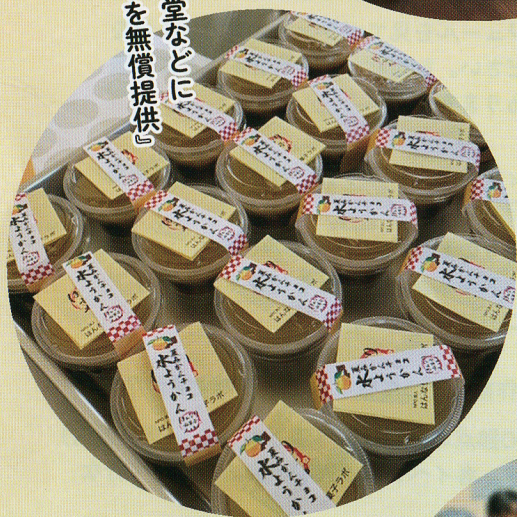
子ども食堂などに 『和菓子を無償提供』