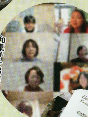
和菓子を出発点として ズームで世界と結ぶ 『はんなりスイーツトーク』