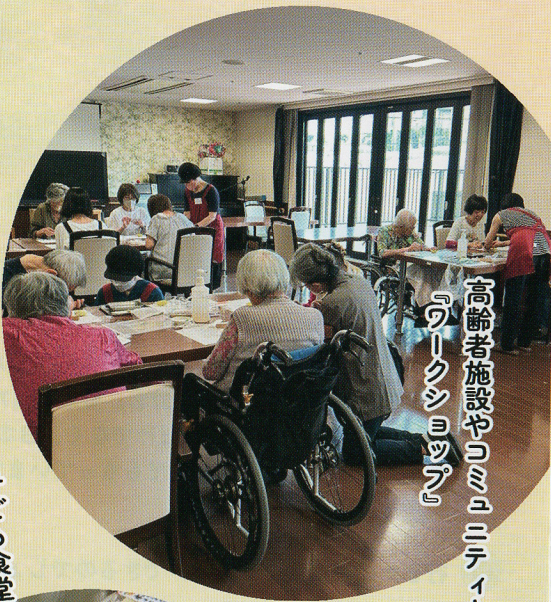
高齢者施設やコミュニティカフェにて 『ワークショップ』