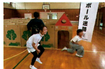
ゴールしてにっこり