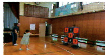
フリスビーでビンゴを狙う!