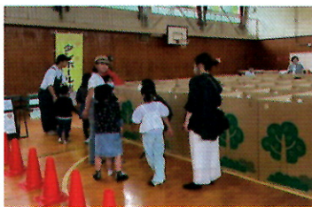
7x7mの立派なダンボール迷路